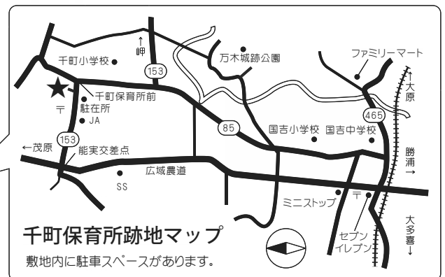
千町保育所跡地マップ 敷地内に駐車スペースがあります。

主催：NPO 法人いすみライフスタイル研究所 協力：夷隅四季の会（「自然の恵館カフェ」主催）